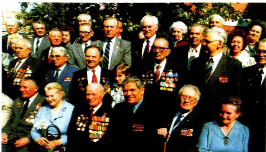
Среди сотрудников ВАСХНИЛ ветеранов войны