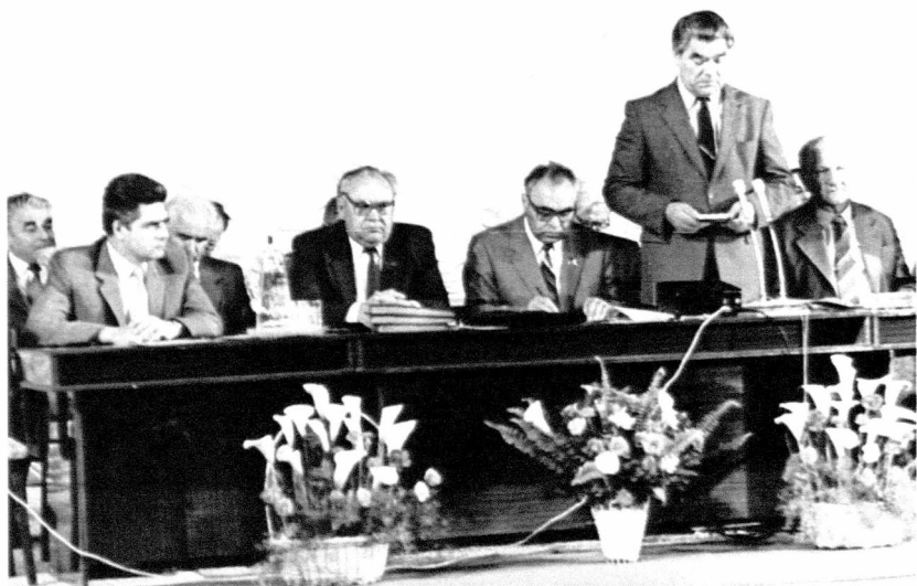
Всесоюзная конференция по вопросам засухоустойчивости. Волгоград, 1987г.