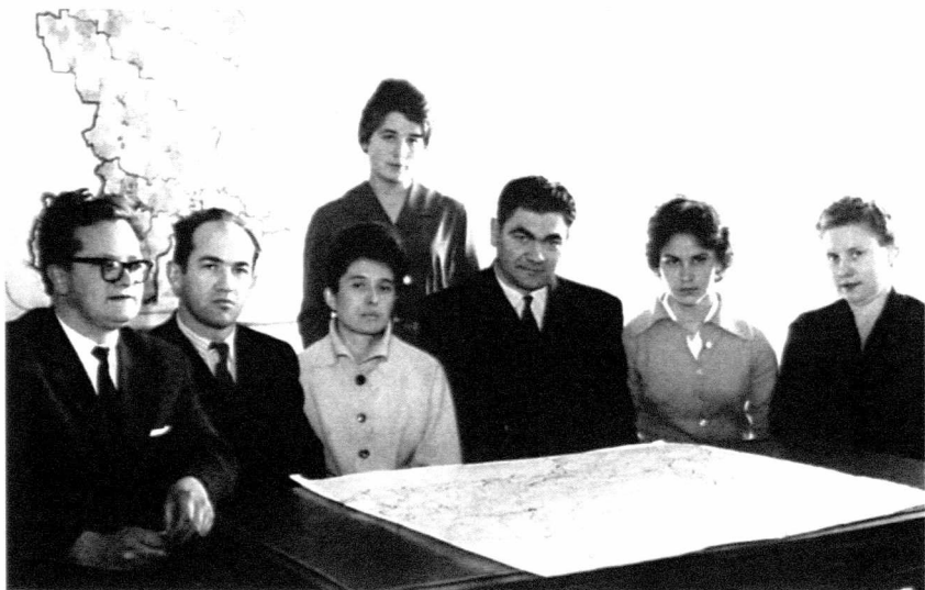
1963-1978 гг. работа в Ставропольском НИИ сельского хозяйства