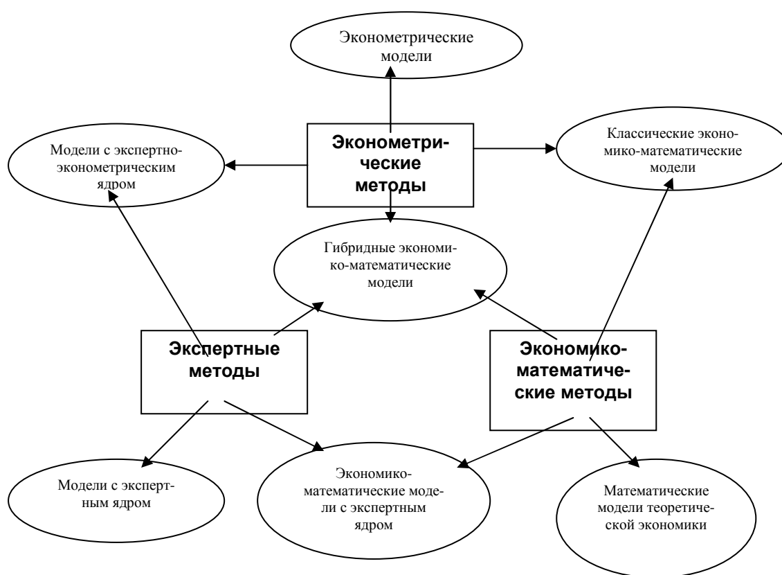
Рис. 1. Типология математических моделей, используемых для моделирования рыночных процессов в аграрной экономике

Анализируя рассмотренные выше классы математических моделей можно с уверенностью предположить, что наиболее подходящим будет класс гибридных моделей, сочетающих в своем составе соотношения, порожденные «канонической» экономикой, дополненные частными эконометрическими зависимостями и математическими зависимостями экспертного происхождения, эмпирически не проверенными по разным причинам.