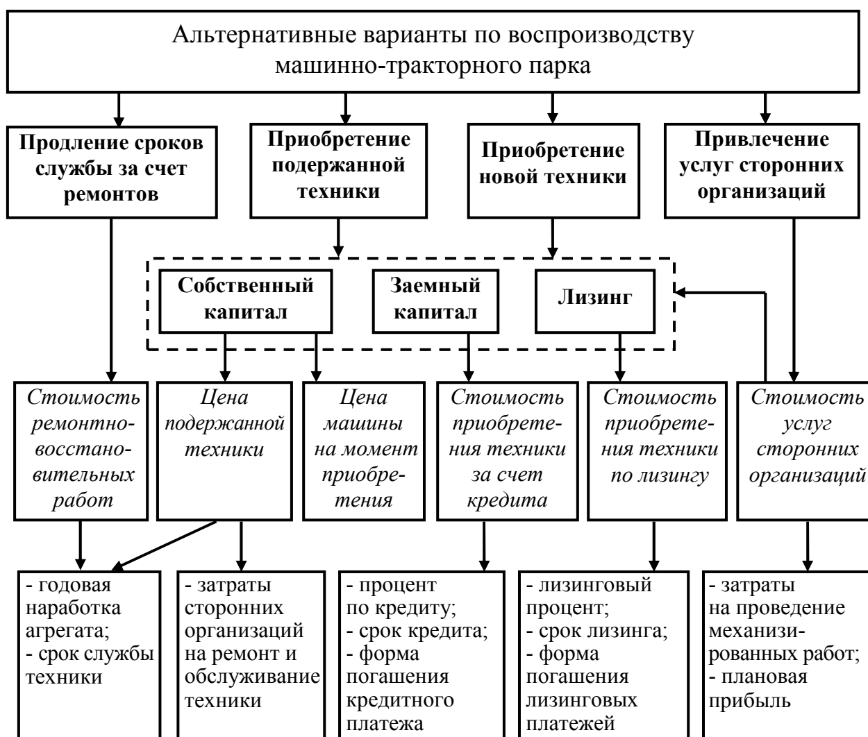
Рис. 1 Обеспечение воспроизводства технической базы сельхозтоваропроизводителей

Функционирование АПК России в условиях рыночной экономики предоставляет сельскохозяйственным товаропроизводителям достаточную самостоятельность для выбора эффективной стратегии воспроизводства техники (рис. 1).