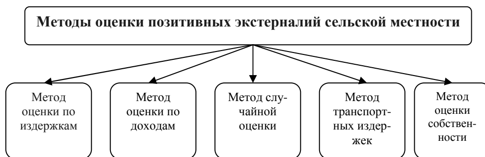
Рис. 1 Методы оценки экстерналий сельской местности.

Метод оценки по издержкам основан на измерении всех затрат стороны, предоставляющей услуги (или доступ к сельским ценностям).