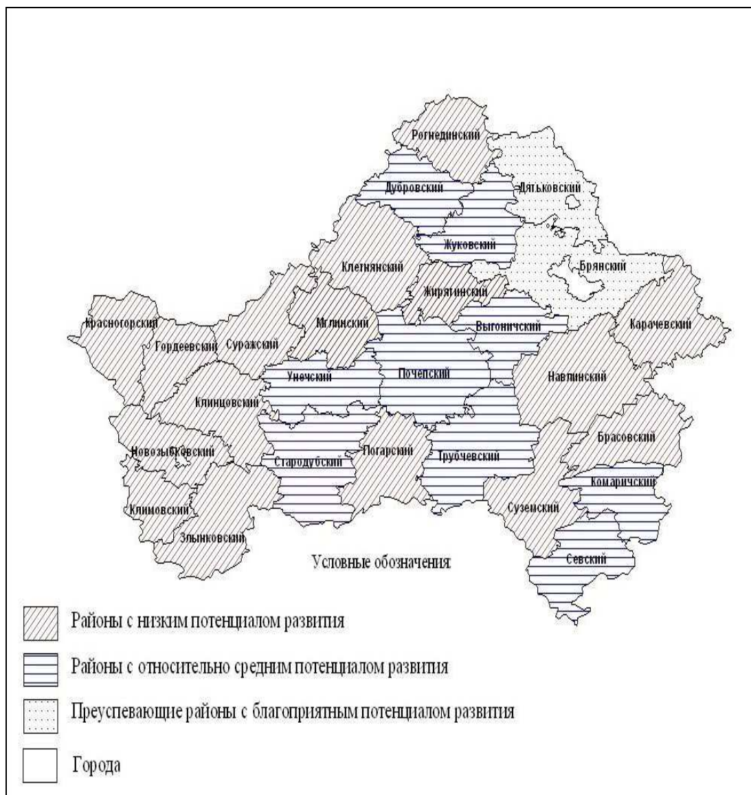
Рис. 4. Типология административных районов Брянской области по уровню и потенциалу сельского развития